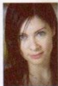
texte Genevève Simard