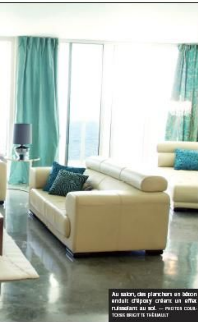
Au salon, des planchers en béton enduit d'époxy créent un effet ruisselant au sol.