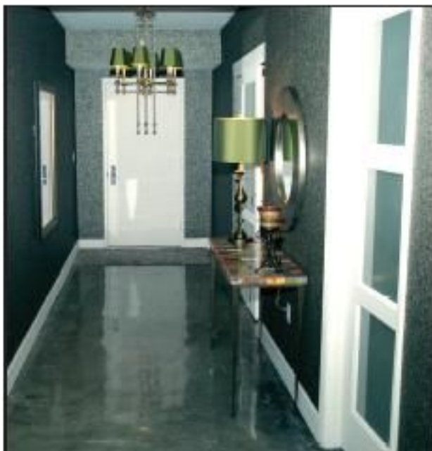
L'effet dramatique du hall a été créé en habillant les murs d'un papier point mica. Le composé minéral brille par son éclat métallique et offre une texture granuleuse au toucher.