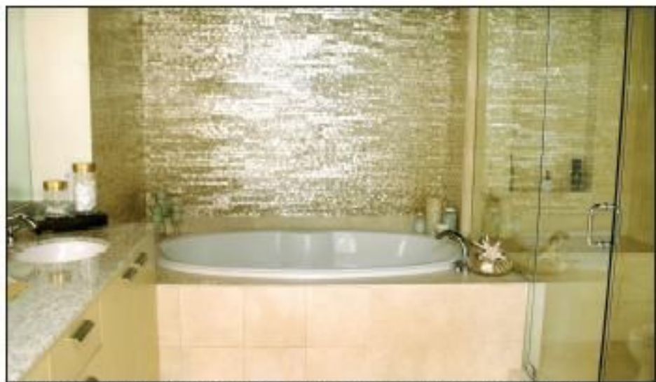
Des tuiles de papier peint en nacre de porce créent un effet glamour spectaculaire au-dessus du bain.