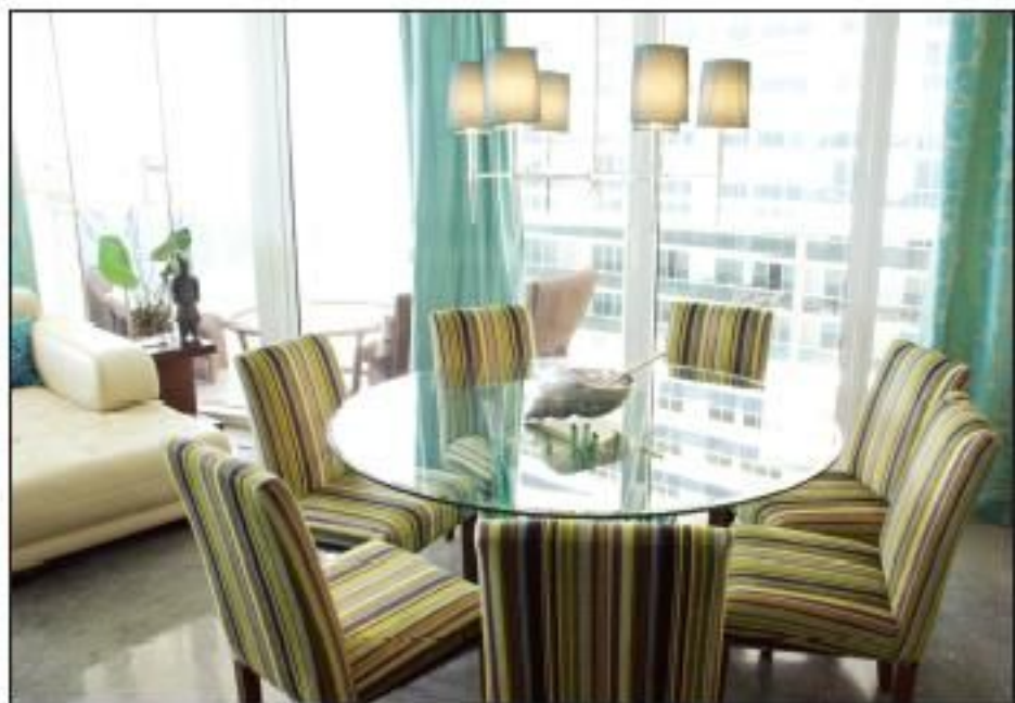
Conviviale, la table de la salle à manger a été dessinée en plexi transparent pour un effet de légèreté.