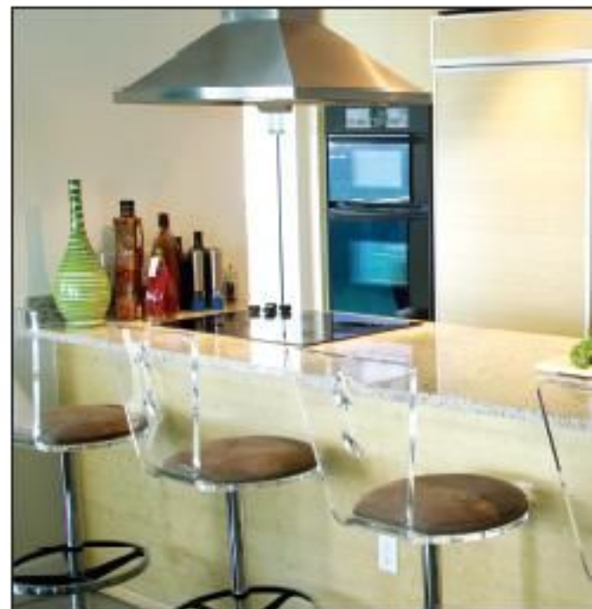
Ouverte sur la pièce à vivre, la cuisine offre le loisir de cuisiner avec vue.