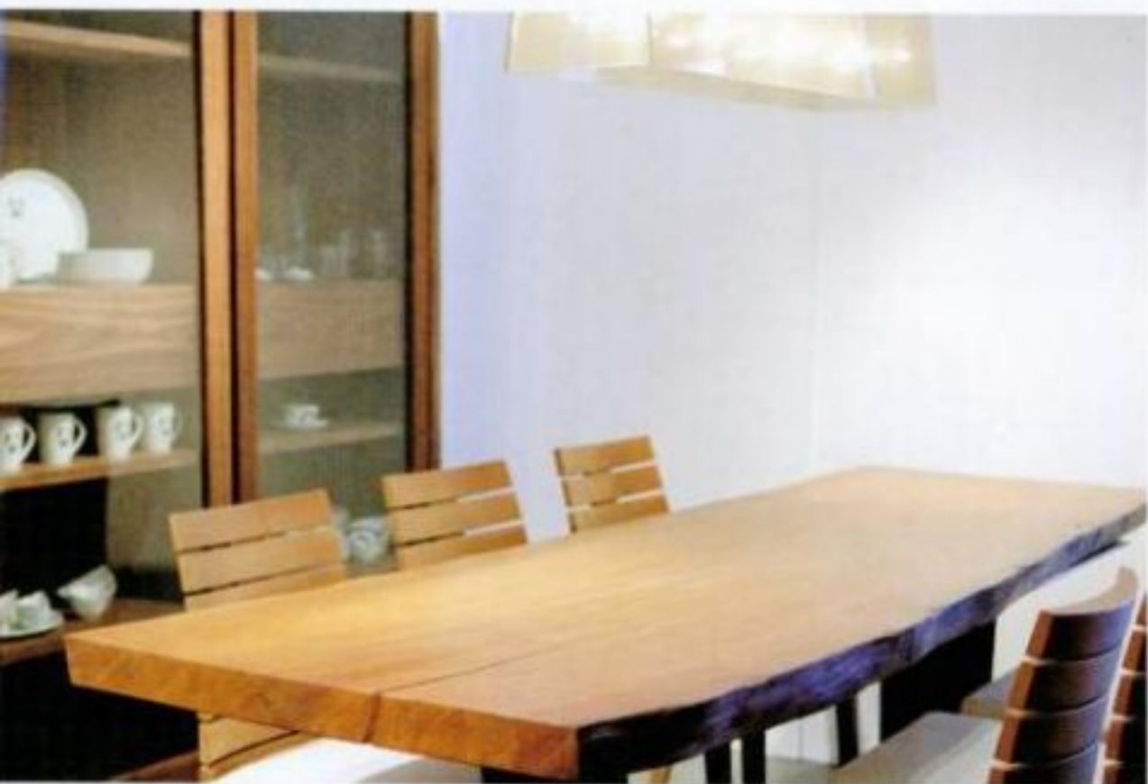
Table en bois de Kauri et abat-jour rectangulaire en acrylique avec un lin fusionné.

Au sein de ce décor, la table à café pourra être en plexiglass ou en cuir, avec un dessus en miroir. Une lampe de plancher, avec une base de chrome et un abat-jour en verre, aura sa place. Une grande carpe sera primordiale afin de délimiter l'espace alloué au salon. Celle-ci sera, bien sûr, en laine ou en shag.