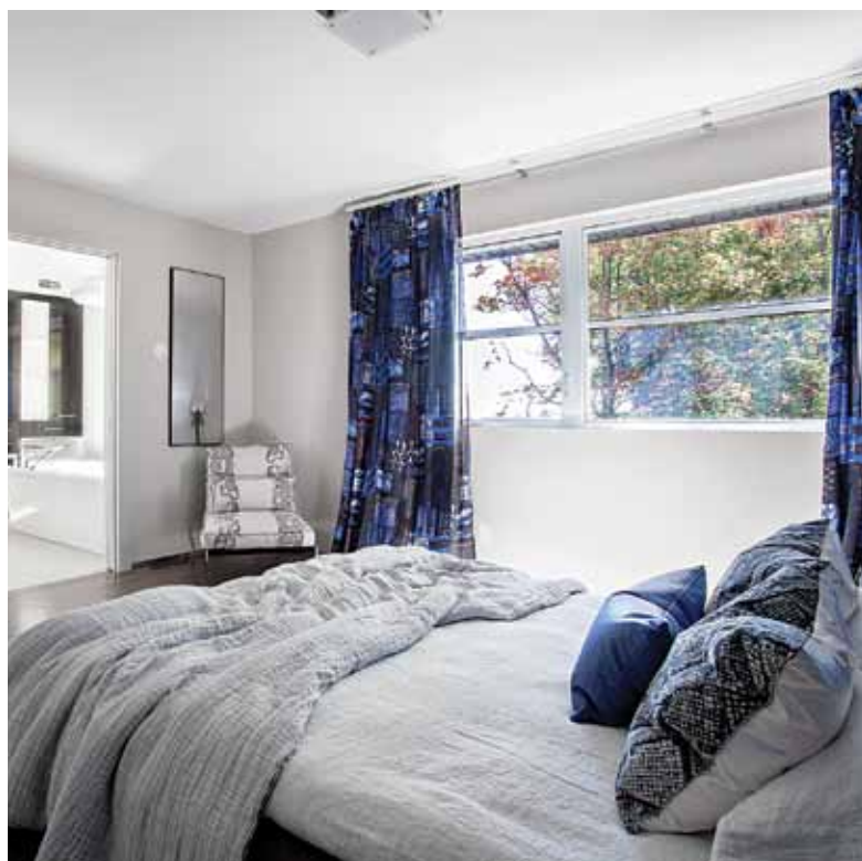
La grande fenêtre horizontale de la chambre offre beaucoup de luminosité, tout en préservant l'intimité de ses occupants.