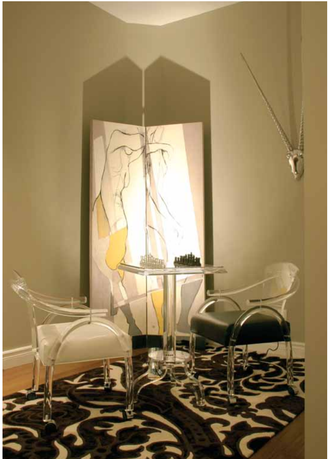
Propos recueillis par Brigitte Trudel

*Astuce : Le dessus de la table formé d'un plateau qui contient l'échiquier se retire. La table se transforme alors en meuble standard et le jeu d'échecs se transporte dans une autre pièce.