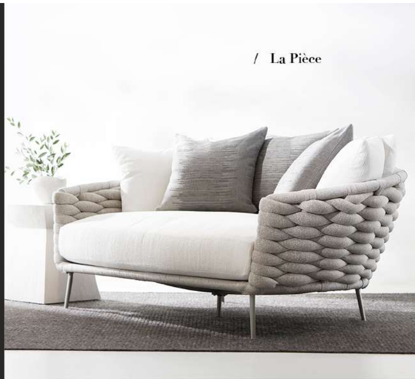
/ La Pièce